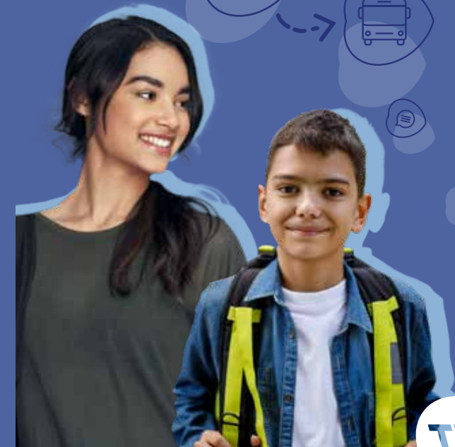
MEDIAPLOTE | 08-20-300 | | Ne pas être sur la voie publique

11 allée du Vieux St Louis, 53000 LAVAL Du lundi au vendredi : 9h - 18h sans interruption. Le samedi : 9h - 12h et 14h - 18h.